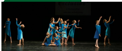
Студия современного танца «Экшн»